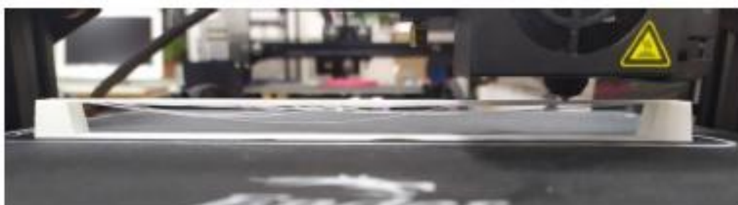
Рисунок 2 - Печать моста длиной 100 мм

Если изделие состоит из мостов, то вероятность исключения поддерживающих конструкций очень низка, потому как мост считается самым сложным выступом из всех. Но и для подобных случаев существуют методы. Во-первых, если длина моста составляет не более 5 мм, то применение конструкции можно избежать и без применения каких-либо способов. Во-вторых, если длина моста всё же больше 5 мм, то его можно распечатать, снизив скорость движения экструдера (печатающей головки). При этом, чем медленнее будет двигаться экструдер, тем более плавно будут накладываться слои, соответственно и качество печати будет на порядок выше. Однако и на этот способ есть ограничение по длине – чем длиннее мост, тем меньше вероятность, что он распечатается удачно, это было доказано пробной печатью моста длиной 100 мм на принтере Creality Ender 3 Pro (рис. 2).