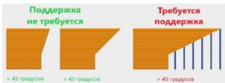
Рисунок 1 - Условия требования поддерживающей конструкции

Однако, если требуется распечатать более сложные изделия, то необходимо выполнить определенные действия по устранению данной проблемы. Она может быть решена либо на этапе моделирования (путем устранения подобных наклонов), либо при слайсинге (при подготовке модели к печати в программе-слайсер) [2].